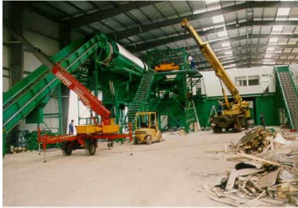
Referenz BIT: Sortierhalle Deponie Untitz

Wir besitzen umfassende praktische Erfahrungen der Planung, Beratung und Überwachung auf den Gebieten Abfallwirtschaft, Verkehrs- und Freiflächengestaltung, Wasserversorgung, Abwasserableitung, Bergbauplanung, Spezialtiefbau, dem Umweltschutz, der Verfahrenstechnik, der Freiraumgestaltung, des Sportanlagenbaus, der Erarbeitung von Genehmigungen nach Bundesimmissionsschutz als auch der bodenmechanischen Fremdüberwachung u.a. für radioaktiv kontaminierte Altlasten.