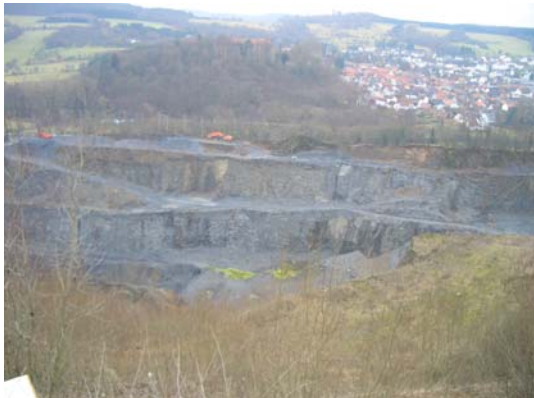
Referenz BIT: Tagebau Ortenberg der Basalt AG

Wir besitzen umfassende praktische Erfahrungen der Planung, Beratung und Überwachung auf den Gebieten Abfallwirtschaft, Verkehrs- und Freiflächengestaltung, Wasserversorgung, Abwasserableitung, Bergbauplanung, Spezialtiefbau, dem Umweltschutz, der Verfahrenstechnik, der Freiraumgestaltung, des Sportanlagenbaus, der Erarbeitung von Genehmigungen nach Bundesimmissionsschutz als auch der bodenmechanischen Fremdüberwachung u.a. für radioaktiv kontaminierte Altlasten.