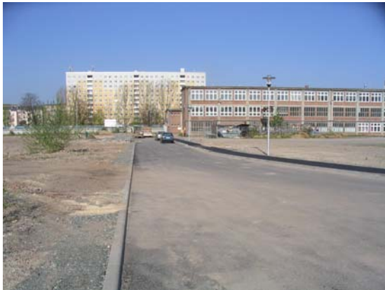
Referenz BIT: Straße im Ufer-Elster-Park

Die durch mich vertretene BIT Tiefbauplanung GmbH ist interdisziplinär als unabhängiges Ingenieurbüro für Planung – Beratung – Bauabwicklung tätig und bearbeitet seit ihrer Gründung 1991 eine Vielzahl unterschiedlichster und einmaliger Projekte in ganz Deutschland. Zu unseren Kunden und Auftraggebern gehören neben Kommunen und Firmen des Mittelstandes auch Großunternehmen, wie z.B. SITA Deutschland, die Wismut GmbH oder die Basalt AG sowie Behörden des Freistaates Thüringen und Sachsen.