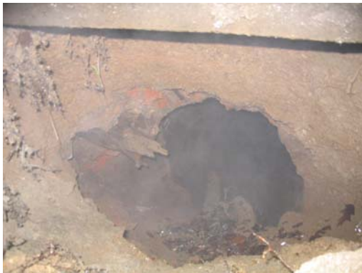
Bsp.: zu sanierender Höhlenbereich

Und nur damit, natürlich ohne des Letzteren, können ein Verein zur Erhaltung der Geraer Höhle e.V., der Höhle instand setzt und damit die öffentliche Sicherheit in unserer Stadt mit garantiert, oder mit der in Deutschland einmaligen Höhlebiennale Leben in die Höhle und Gäste in die Stadt bringt,