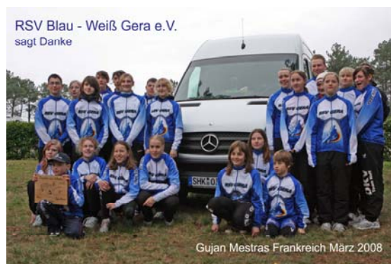
Bsp.: Danksagung des Vereins