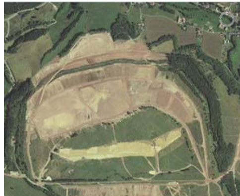
Referenz BIT: IAA Trünzig der Wismut GmbH

Persönlich engagiere ich mich als „Netzwerker“ ehrenamtlich