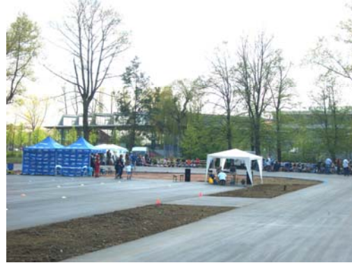
Referenz: Rollschnellaufbahn Meißen

Dazu einige Beispiele für Projekte aus dem Sportstättenbau von Sachsen über Thüringen bis Brandenburg. Auch Gera ist dabei, wobei, ich denke, auch hier noch Reserven vorhanden sein sollten.