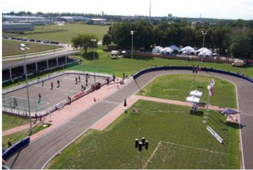
Referenz: Skate-Arena Jüterbog

Im Rückschluß sollte natürlich auch der eine oder andere Auftrag in unserem Büro eingehen.