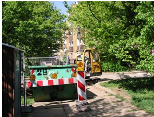
Bsp.: Unterstützung durch GSW GmbH

als auch ein Rollschnelllaufverein, der u.a. auch eine Europameisterschaft in unserer Stadt organisiert, jetzt auch eine Europa- und Vizeweltmeisterin besitzt und seit Jahren der erfolgreichste deutsche Verein ist,