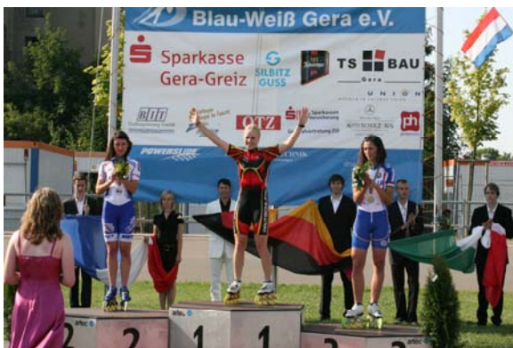
Bsp.: Erfolge und Sponsoren

als auch ein Rollschnelllaufverein, der u.a. auch eine Europameisterschaft in unserer Stadt organisiert, jetzt auch eine Europa- und Vizeweltmeisterin besitzt und seit Jahren der erfolgreichste deutsche Verein ist,